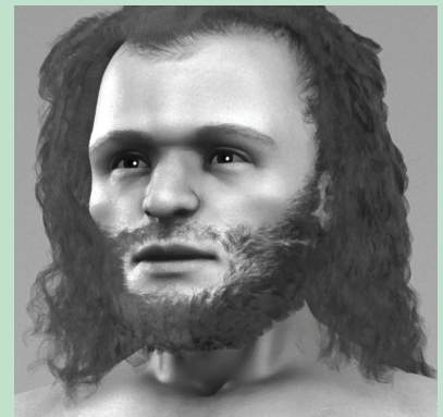
კრომანიონელი ადამიანი (რეკონსტრუქცია).

კრომანიონელი ადამიანი Homo Sapiens Sapiens-ს მისი პირველი აღმოჩენის ადგილის, კრომანიონის (საფრანგეთში) მიხედვით ეწოდა.