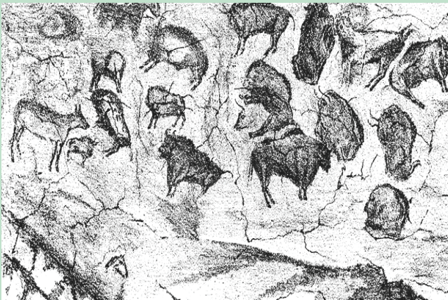
ალტამირას გამოქვაბულის მხატვრობა. ესპანეთი. XVI-IX ათასი წელი ჩვ. წ. აღ-მდე.

მართლაც, როგორც წინარეისტორიული, ისე დღევანდელი ადამიანის გამორჩეული თვისება მისი მობილურობაა. პირველყოფილ ადამიანს საკვებისა თუ უკეთესი პირობების