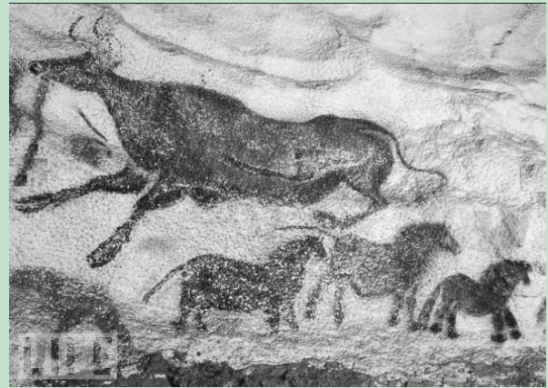
საფრანგეთში, ლასკოს გამოქვაბულში 2000 ფიგურა 17 000 – 18 000 წლის წინაა დახატული.