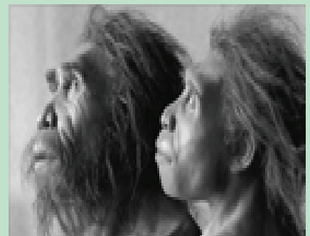
მზია და ზეზვა (რეკონსტრუქცია)